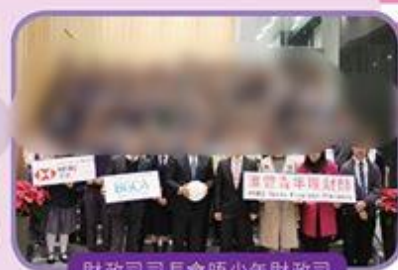
財政司司長會晤少年財政司