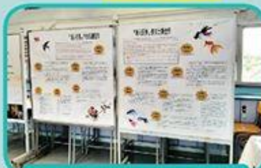
2018-19開放日中國文化學會攤位