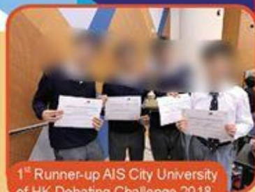
1 st Runner-up AIS City University of HK Debating Challenge 2018

英文學會在12月舉辦了樂在培愛的活動(Joy to Pui Oi Service Learning Activity)。英文學會聯同健康管理與社會關懷科學生，帶領香港基督教服務處培愛學校的學生製作聖誕飾物及小吃，又一起表演聖誕歌曲及演繹聖誕故事。本活動不只增加學生運用日常英語的機會，同時亦讓學生參與社會服務。