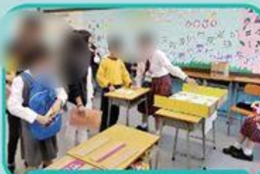
2018-19開放日中國文化學會攤位