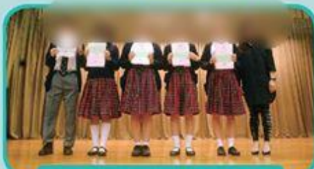
「欣賞自己」徵文比賽高級組得獎者