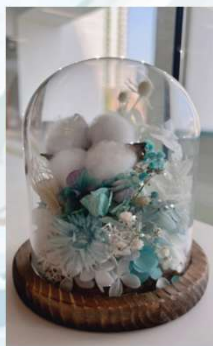
「轉念·浮游花 工作坊」