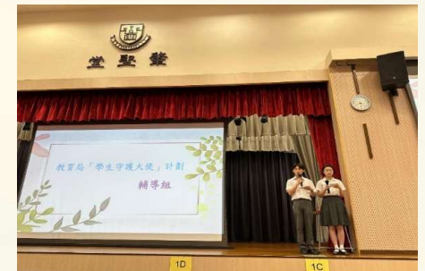
「自我關懷 創造幸福 分享會」