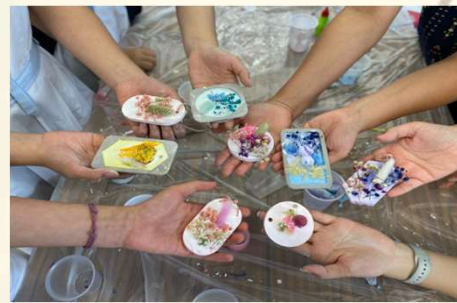
「療癒身心靈手作坊」