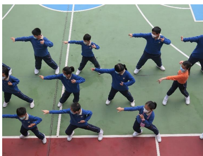
2021年12月16日體育八段錦