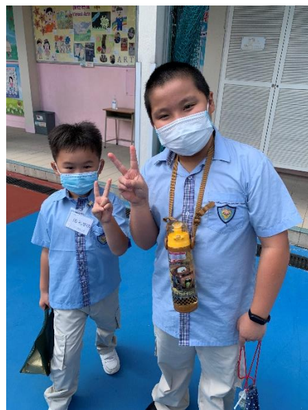
由大哥哥、大姐姐陪伴實踐

2021年9月至10月期間，我校舉行小三至小六的「班門設計」，以「自信有禮寶覺人」為題，結合同學的設計元素及班本特色，新設計會成為班門，提升歸屬感。