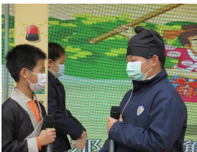
2022年1月13日中文科武松打虎