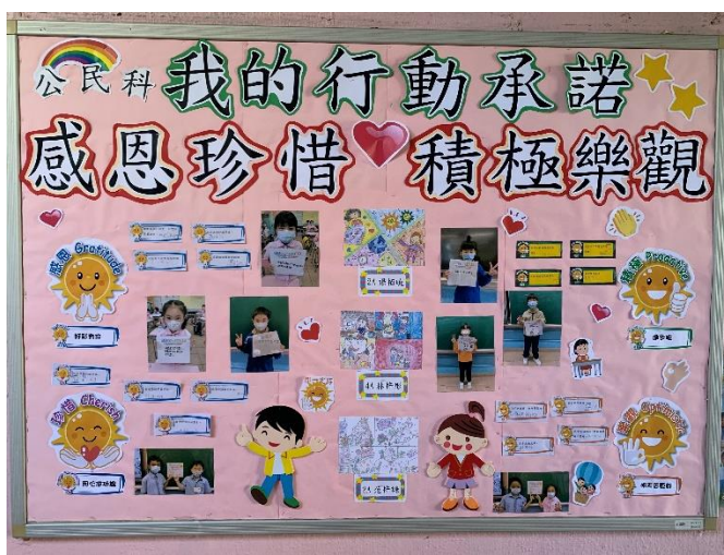
學生寫下感想，教師把感想在走廊壁報版上分享

2022年4月25日開始，為加強復課後的支援，增設「書籤獻關懷 延伸活動」，把原來小五及小六的書籤獻關懷活動延伸至全校師生，鼓勵教師多撰寫心意卡支持學生，加強師生連繫，欣賞學生在行為、態度上的進步。