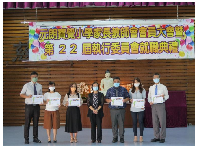
2021年9月7日 家教會就職典禮