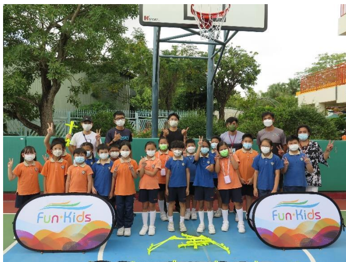
2021年11月5日學校活動日