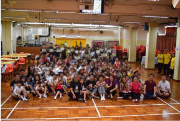
「用愛與勇氣·拉近孩子與善的距離」正向家長快樂孩子運動大合照。

學校透過親子活動加強學校與家長的聯繫,本年邀請香港教育大學課程與教學學系高級講師吳卓穎博士舉行「用愛與勇氣·拉近孩子與善的距離」正向家長快樂孩子運動。透過親子表達藝術治療工作坊的體驗形式,在導師的引領下,讓家長和孩子一同初探藝術治療的形式及作用,增加親子間的了解及溝通。活動中,親子一起伴隨音樂起舞,參加者也表示很久沒有與孩子跳舞,也感到開心及特別。家長和學生一起設計屬於自己的桌上遊戲,過程中,他們有商量而且也覺得份外珍重,因為這是獨一無二的遊戲,他們也表示會在家中繼續玩這個桌上遊戲。是次活動參加者也表示能夠拉近了親子的距離,他們也了解更多正面的親子互動方法。