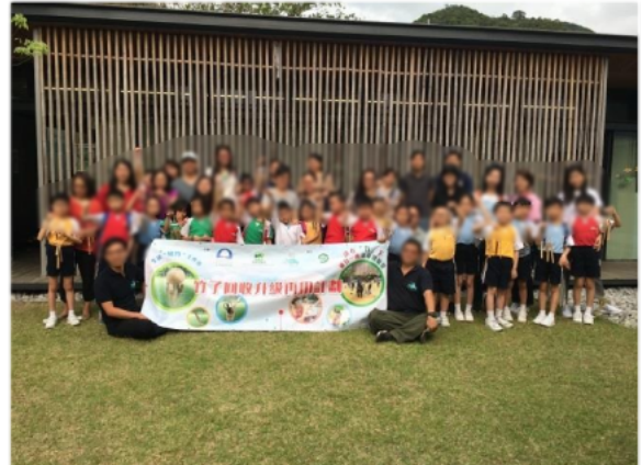
親子一起了解環境保育的重要。