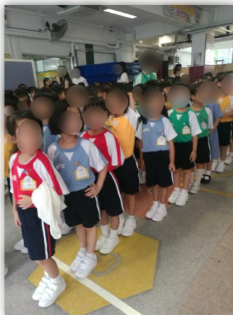
小一在學校操場學習集隊。