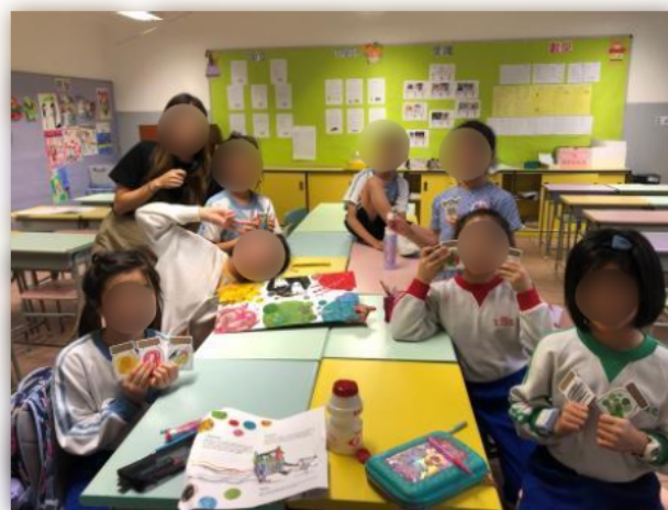
同學學習以合適的方法來表達不同的情緒。