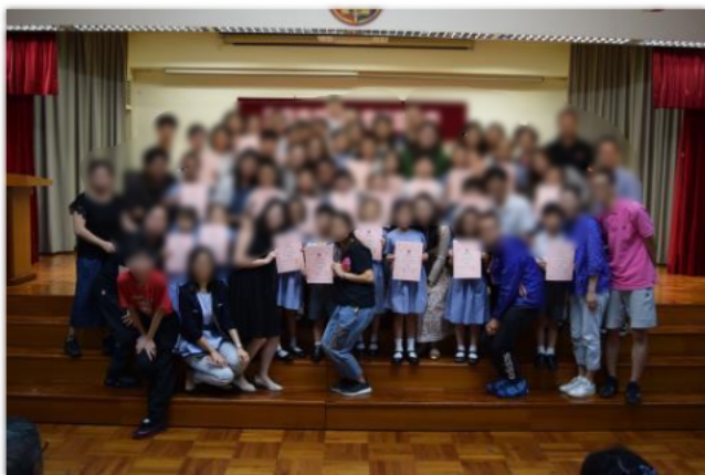
飛躍之星及寧馨兒頒獎典禮大合照。

本校設有「飛躍之星」選舉及「寧馨兒」選舉,「飛躍之星」的設立目的是鼓勵及表揚在品行及成績方面有進步的同學,從而讓他們建立自信心,肯定自我,努力向前。設立「寧馨兒」是為了表揚品學兼優及於課外活動有優秀表現的同學。典禮中設才藝表演,讓學生分享成果。根據18-19年度情意及社交表現評估問卷(APASO),稱讚的平均數是2.81,比較全港平均數2.65為高,顯示學生在不同的獎勵計劃及頒獎典禮之中,感受到老師的肯定及欣賞。