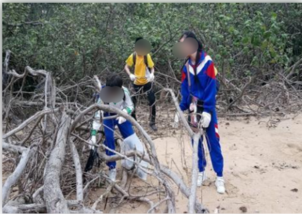
親子一起清潔郊野公園及沙灘。

學校每年均舉辦親子義工活動,除了服務社區之外,亦可以建立正面親子關係。本年度學校與基督教香港崇真會沙田綜合服務中心合辦「親子清潔郊野公園」義工活動。當日於馬鞍山郊野公園進行清潔活動,以喚醒同學對愛護環境的關注,提升同學服務社區的承擔精神。參加者也表示活動予其很好的體驗,家長也在過程中欣賞孩子的付出,而孩子亦開心得到家長的支持。