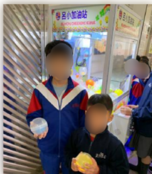
學生可以用電子小證書換取「夾公仔機」遊戲體驗

學生可以憑電子小證書換取禮物或者換取「夾公仔機」的遊戲體驗。透過以上的活動,學生與師長會建立正面欣賞關係,當學生遇到困難或問題時,他們也信任師長,並且會向老師傾訴。根據18-19年度情意及社交表現評估問卷(APASO),師生關係的平均數是3.22,比較全港平均數3.20為高,可見學生與老師之間建立了正面及信任的關係,學生感受到老師的肯定及鼓勵。