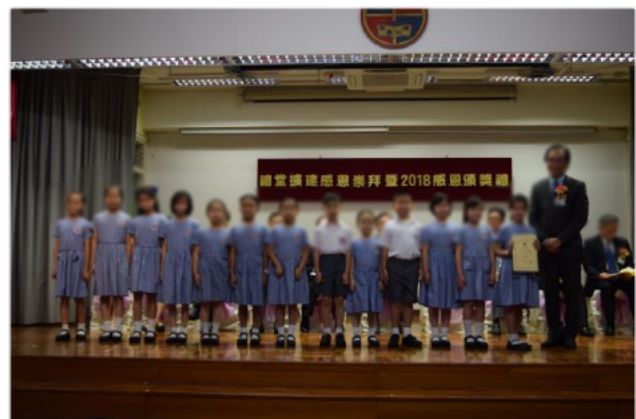
愛心大使獎得獎同學大合照。