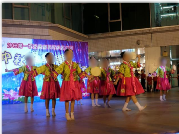
學生在中秋晚會上跳舞表演。

家長積極參與社區舉辦的活動,例如,中秋表演會,家長會與子女一同賞月及慶祝中秋,學生亦在中秋表演會中表演,得到家長的支持。另外,家長踴躍參與國際學校新春活動,在普天同慶的日子裏,與眾人一起慶祝及玩攤位遊戲,家長都表示很高興。此外,每年一度浸聯會步行籌款也得到家長的支持,除了捐款之外,家長與子女一同步行籌款,過程之中,他們也表示更能融入學校及社區。