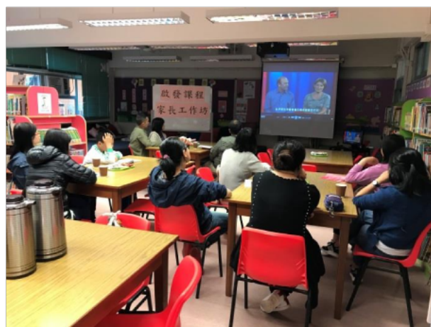
家長一起觀看影片以學習正面管教方法。