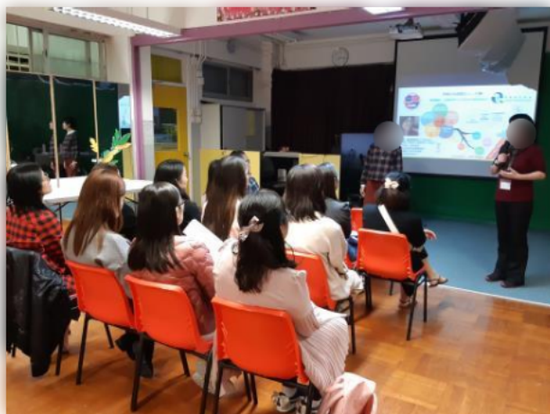
家長留心聆聽導師分享正面的管教方法。

另外,學校舉辦「快樂家長」小組,為來年度小一家長作準備。幼稚園學生升讀小一時,相信家長及學生也面對重大的轉變。小組協助家長定下對孩子的期望,家長亦可以在小組內分享其擔憂。導師會與家長分享協助孩子適應小學生活的方法,並分享不同正面管教的小技巧。