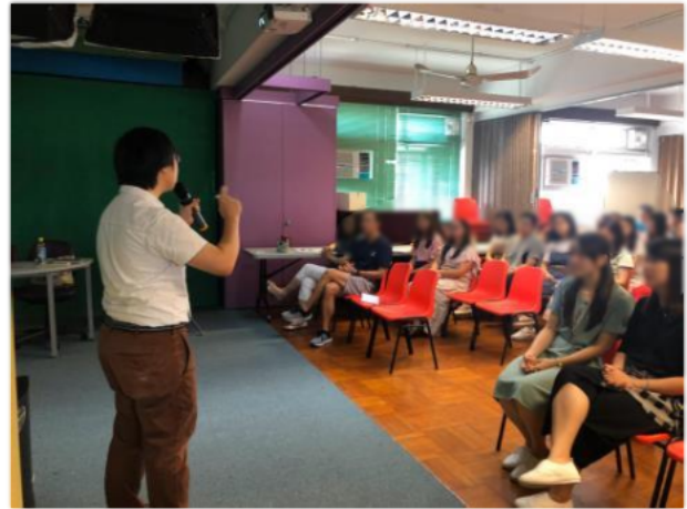
培訓教師協助學生掌握培養良好品格的方法。