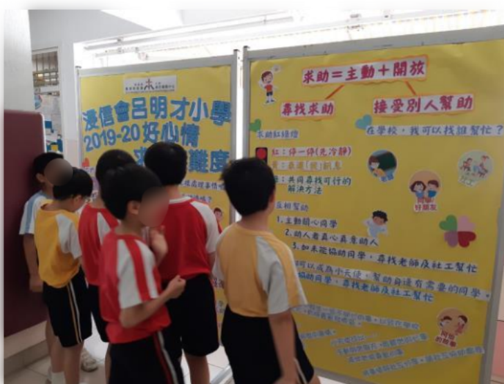
同學細看展板,並且積極回答問題。