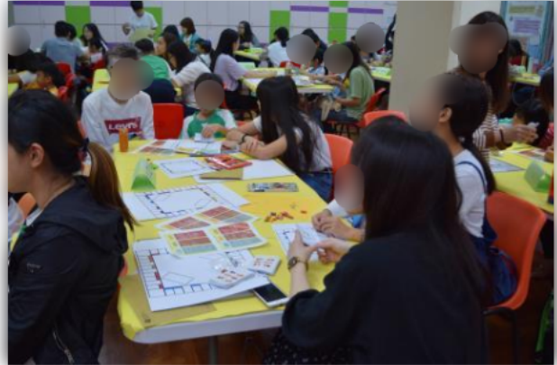
親子投入設計自己的桌上遊戲,他們都表示體驗活動很有趣。