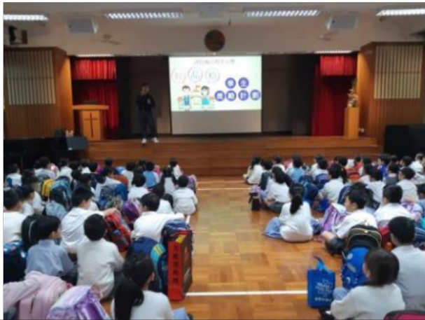
舉辦「好品格」計劃講座,同學們認真聽導師講解。

學校致力培養學生良好品格,設不同獎勵計劃,今年度推行「好品格獎勵計劃」。好品格包括承擔精神、責任感、尊重、關愛、誠信、自律、堅毅及感恩等,亦藉著不同活動,提升及培養學生成為「主動」及「謙遜有禮」的學生。計劃包括啟動禮、教師培訓、家長講座及感恩週等。當學生在校內、活動或日常生活中出現好行為,老師及家長可以透過品格教育應用程式欣賞其品格強項,並可給予文字上的鼓勵。由於疫情關係,本年度先由老師運用應用程式加分予學生家長則於下學年開始使用應用程式。老師透過應用程式更可以分析出參與學生在14個品格強項中的分佈了,解學生的強弱,分析整體學生的品格強項分佈,協助計劃調整以作對應。此外,透過欣賞學生性格強項,鼓勵學生培養好品格。每位學生能夠參與其中,而且其行為表現也得到老師及家長的關注及欣賞,學生也積極投入參與計劃。