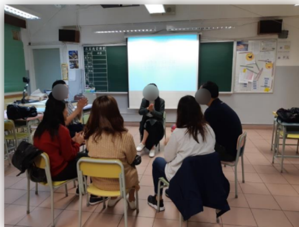
家長互相分享自己的管教方法。