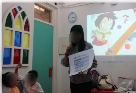
同學認真投入聽導師講故事及積極發問。