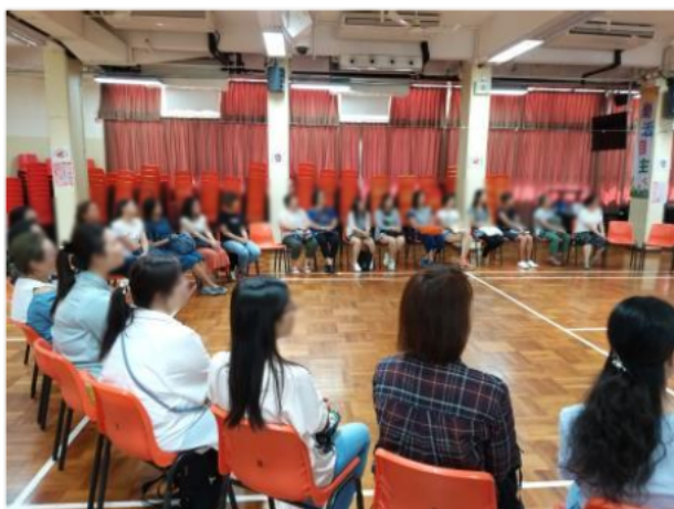
家長一起參加團契崇拜,認識主及互相支持。

學校會邀請家長參加家長團契,鼓勵家長認識主,家長可以在團契之中認識不同年級的家長,大家在主的保守下互相支持,家長表示當面對管教的困難時,團契的組員能夠給予力量,根據學校校本問卷調查,92%家長覺得班主任老師關懷他們子女的學習和成長,感受得到老師的關心,並建立正面的合作關係。