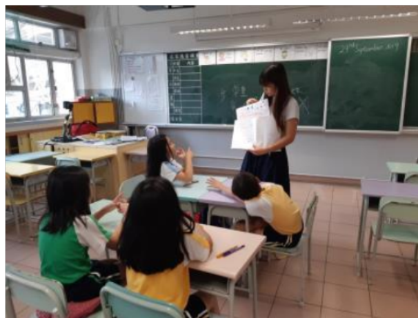
同學專心聽導師的講解。