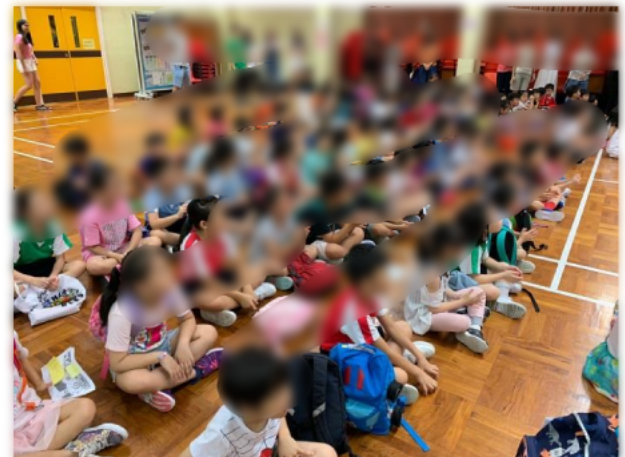
同學一起回顧過往一年所發生的事。