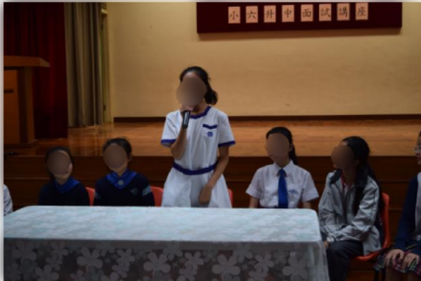
畢業生師姐向學生及家長分享。

學校邀請畢業生回校分享中學校園生活,為學弟妹升中作支援,當中畢業生分享面試心得及須知,同學均表示分享會能夠更加具體掌握面試的技巧,並且了解到中學的課程。過程之中,更會有傳燈禮儀式,喻意將本校的優良傳統以及照顧學弟學妹的責任傳承給新一屆六年級學生。