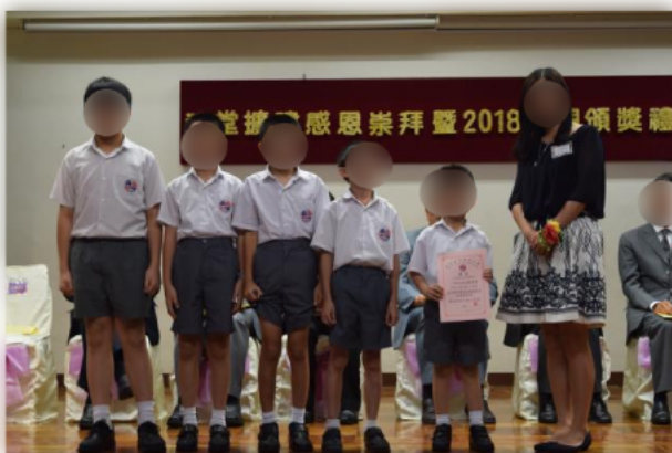
得獎同學上台獲獎,同學們也表示開心及興奮。

學期完結時,學校會舉辦「感恩頒獎典禮」,當中邀請嘉賓上台頒獎,以肯定同學這一年來的付出及努力。獎項多元化,以鼓勵學生在不同範疇發展。獎項包括,成績進步獎、操行進步獎、服務獎、愛心大使獎、最具創意獎、藝術優異表現獎等。同學表示頒獎典禮能夠給予他們肯定及支持,使其更有繼續努力之動力。