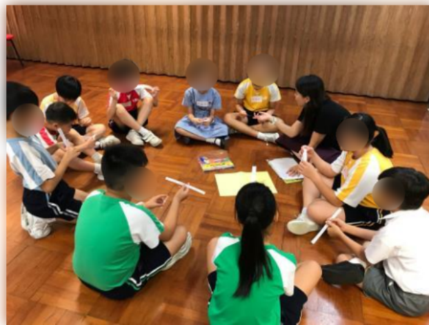
同學就不同的情景與組員討論處理的方法。