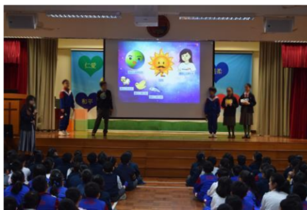
為高小學生舉行「正向思維」講座,同學積極上台參與活動。