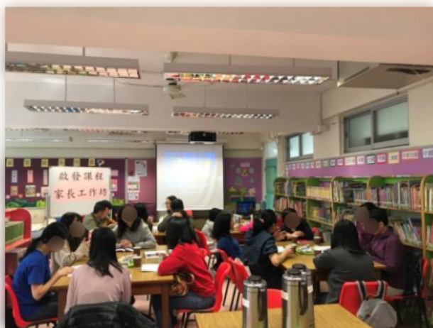
家長積極討論不同正向管教的方法。

本校一向致力推動正向教育,引導學生們常存感恩的心,以多角度去面對事情的挑戰。建立孩子正向態度,需要家庭的付出與支持,深知道家庭教育將影響孩子的全人發展及至人生價值觀的方向,因此,本校舉行「啟發課程」家長工作坊,讓家長學習以正向、互信、互勵、互勉的雙贏方法,引領孩子渡過不同的成長階段。參加者也表示工作坊能夠了解更多管教方法,而且工作坊亦有互動的環節,家長可以藉此機會分享自己的心得,彼此交流。家長也覺得工作坊有助他們正面管教孩子。