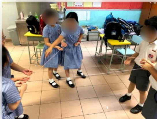
同學合作一起在限時內拍英文字卡。