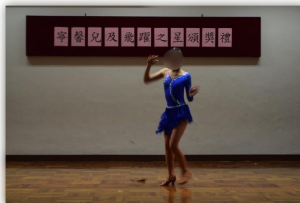
同學即場表演及跳舞。