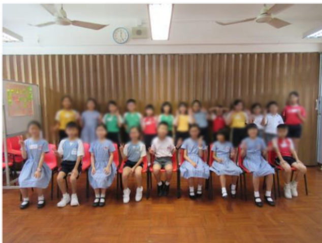
大哥哥大姐姐合照,並宣誓為小一新生服務。

為建立校園的關愛氣氛,本校設「大哥哥、大姐姐」計劃,訓練高年級學生照顧及關愛小一學生,協助小一學生與朋輩和諧相處,同時讓小一同學感受到他們的關愛,從而提升小一學生對於學校的歸屬感。大哥哥大姐姐會為小一同學檢查手冊、教導小一同學做功課等,使小一同學更快適應校園生活。