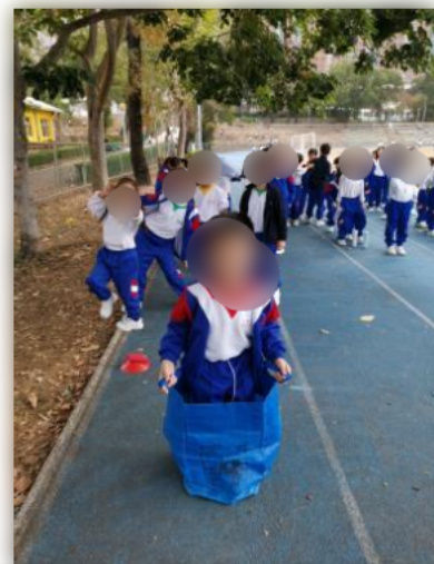
同學積極參與障礙賽,完成後也感到開心。