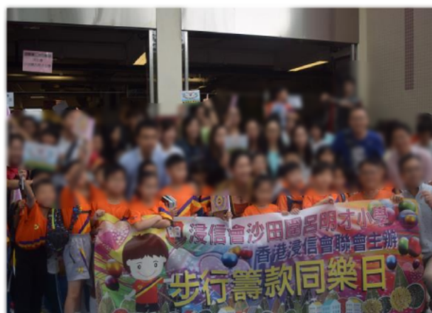
家長及學生一同參與浸聯會步行籌款。