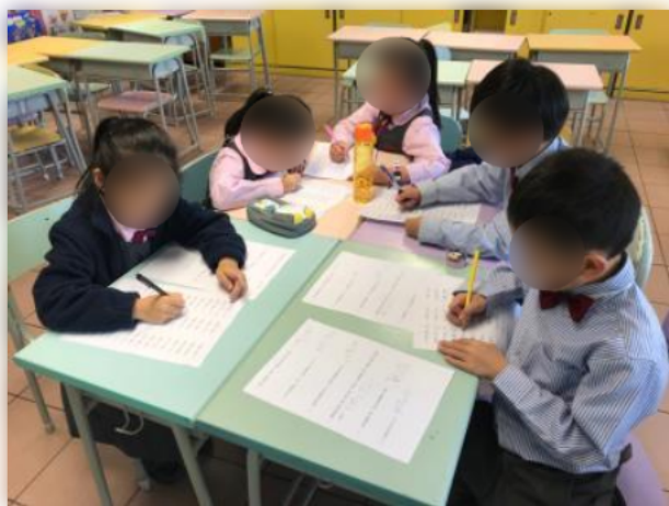
同學認真完成導師給予的練習。

另外,學校舉辦學習動機小組,為個別有需要的學生提供針對性的輔導。小組主要協助同學發掘其學習潛能,以提升學習動機,內容包括,訂立志向、教授學習技巧、進行趣味記憶遊戲及定期檢討學生的學習進度及情況。根據學生問卷調查,90%組員表示小組能夠提升自己的學習興趣,加強對自己的自信心,而且體驗學習亦是一件快樂的事。同學表示希望來年可以繼續參與小組,老師也表示同學在課堂上也較以往積極回答問題。