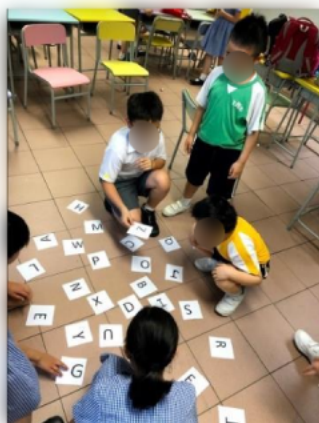
同學合作解開繩結。

另外,學校為高低年級舉辦「情意教育」小組,目的是透過一些解決困難和決策遊戲(Problem Solving & Decision Making Games),讓學生體驗與學習一些有效的解難方法,勇敢克服所面對困難,藉此提昇學生個人及團隊方面的素質,提昇自信心、激發冒險及探索精神、提昇解難能力等。活動亦旨在改善學生的社交技巧,如認識有效的溝通法、學習欣賞自我和他人、建立互信關係和發揮團隊合作精神等。同學均表示參加小組能提升自信心,而且懂得處理與人之間的衝突,並且更懂得欣賞自己及別人。