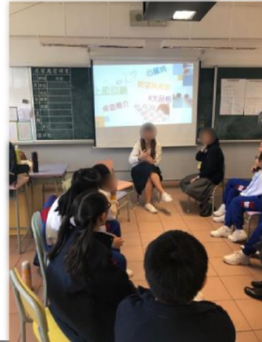
同學與導師一起體驗不同的桌上遊戲,與同學一起討論,啟發其想法。