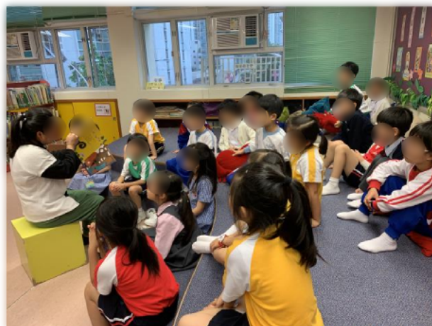
同學們專心聽故事姨姨講故事。