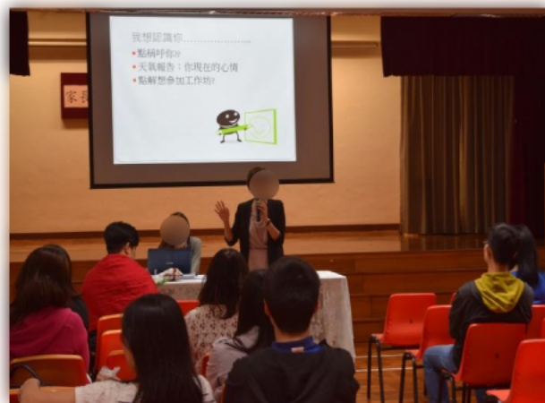
家長投入聆聽講者的分享,並且踴躍發問。

其次,學校邀請基督教香港崇真會沙田綜合服務中心舉辦「正向親子管教」家長講座,當中分享到正向的溝通模式及好處,並透過影片及實際的個案分享,讓家長能夠更具體掌握正向溝通的方法及重要性。