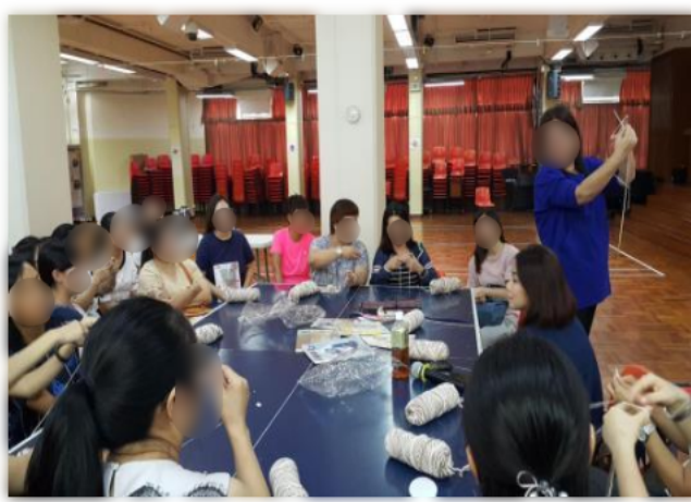
家長一起編織頸巾並送給社區有需要人士。