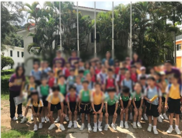
歷奇訓練日營大合照。

透過小二至小五的歷奇訓練日營,同學的自信心得以提昇,活動對象為個性較被動的學生。日營主題圍繞自信的五大元素,包括,欣賞自己、不放棄、樂觀面對、與人分享、相信自己。上午的活動以「小組組名」、「自信先鋒」、「一分鐘挑戰」等團隊合作的活動來建立同學之間合作的團隊精神。同學需要與組員商討解決方法,例如,同學在「一分鐘挑戰」活動中需要互相協調才能拋出乒乓球。下午活動則以「營地大追蹤」等體驗性的活動進一步鞏固同學在團隊溝通及解難技巧上的學習。根據問卷調查,90%參與的同學表示訓練活動可以幫助他們提昇自信心,90%同學表示參加訓練活動後更欣賞自己及別人。根據18-19年度情意及社交表現評估問卷(APASO),成就感的平均數是2.89,比較全港平均數2.78為高,可見活動有助增強學生的自信心及成就感。