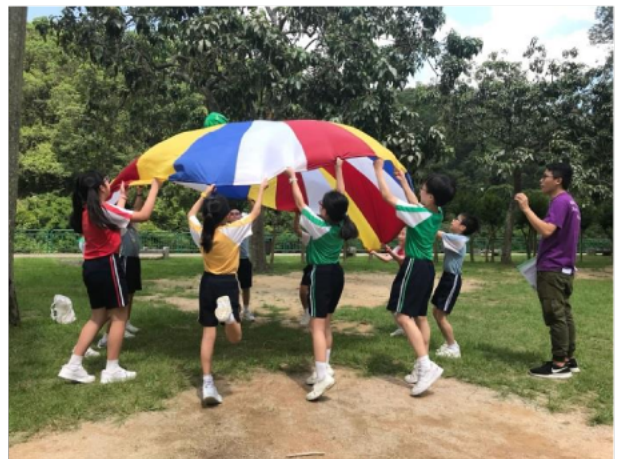
同學一起合作運用快樂傘控制沙灘球。