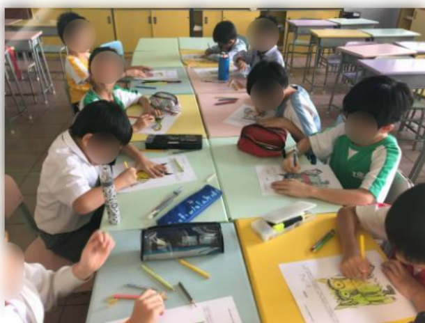
同學繪畫「我的情緒」,認識自我情緒。

學校透過社交小組及不同的訓練提升學生管理情緒及社交技巧,為小二至小三的同學舉辦「情緒小博士」小組,提升學生控制情緒的能力。小組透過認識自我的情緒,促進他們建立良性的人際互動經驗。內容包括,訂立目標、認識自我情緒、培養行為抑制能力、增加社交溝通及合作能力等。參加的同學也表示小組讓他們更認識自己的情緒,而且更懂得面對負面情緒。根據18-19年度情意及社交表現評估問卷(APASO),負面情緒的平均數是1.64,比較17-18年度1.73降低了,可見學校所舉辦的小組及活動能夠幫助學生建立正面價值觀,能夠轉化負面情緒為正面的態度。