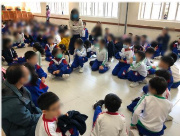
同學與組員分享其感受及想法。

學校為全級小二學生舉行「感恩歷奇訓練」日營,讓同學能在輕鬆的氣氛及戶外的環境中,藉群體生活及不同形式的挑戰活動學習感恩、珍惜、積極和樂觀四種正面價值觀。同學們也學懂感恩及欣賞身邊的人和事。活動後,同學均表示活動能夠讓他們懂得欣賞及關愛別人,而且在參與不同的歷奇活動之中,有機會與同學合作及溝通,更懂得與別人表達自己的意見及想法。