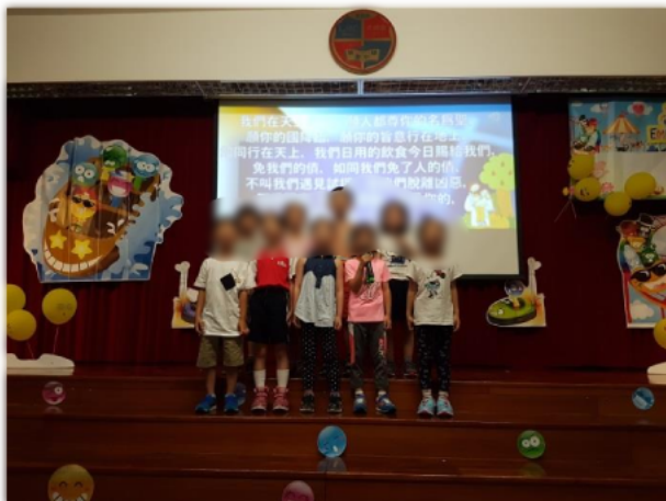
同學們一起唱詩歌,學習基督的精神及積極的態度。

學校在暑假舉行「暑期聖經學校」,透過分享聖經金句及故事,讓學生學習基督的精神及積極的態度。在暑假期間,導師與學生回顧過往一年所發生的事,檢視在學習或生活上的表現,為學生準備迎接新一年的挑戰。根據18-19年度情意及社交表現評估問卷(APASO),學生經歷的平均數是2.87,比較全港平均數2.82為高,可見學生感到在學校能夠透過不同的活動體驗不同的經歷,而且在當中能夠幫助整理自己所學到的。