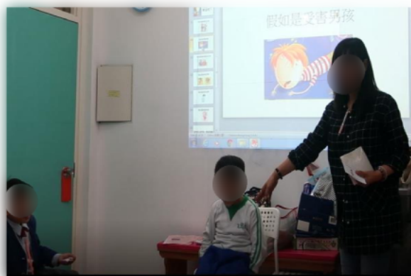
導師邀請學生作角色扮演及分享。

設立正向閱讀小組,對象為行為及情緒上有困難的小一及小二學生。透過繪本故事分享形式,讓學生學習處理與人發生衝突及憤怒情緒的方法,再反思雙方在衝突中的責任,學習以體諒及寬恕的態度處理衝突和仇恨。參與小組後,學生也表示更加懂得體諒別人及了解自己的情緒,老師及家長也留意到學生在社交及情緒上也有明顯的進步。