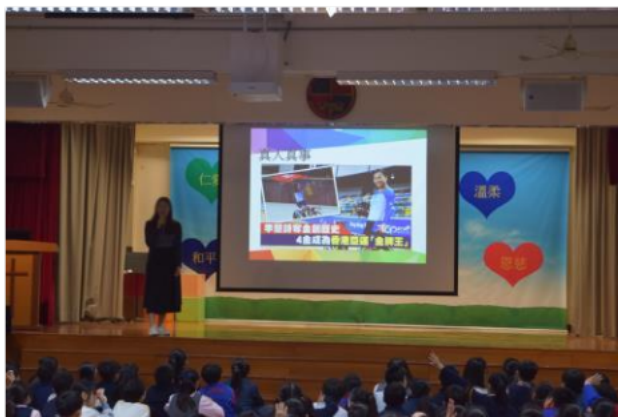
為初小學生舉行「快樂七式」講座。

與此同時,本校為各年級同學舉行正向教育學生講座,初小主題為「快樂七式」及「解難四步曲」,高小主題則是「正向思維」及「天生我才必有用」。藉著講座,讓學生了解正面的人生態度,以培養孩子的積極正面的人生觀。學生表示參與講座後,認識了以不同的角度欣賞自己及感恩身邊的人和事,並且在日常生活之中發掘自己的長處,遇到困難及逆境可以有方法面對。根據18-19年度情意及社交表現評估問卷(APASO),負面情緒的平均數是1.64,比較全港平均數1.68為低,可見學校所舉辦不同的活動能幫助學生建立積極正面的價值觀。