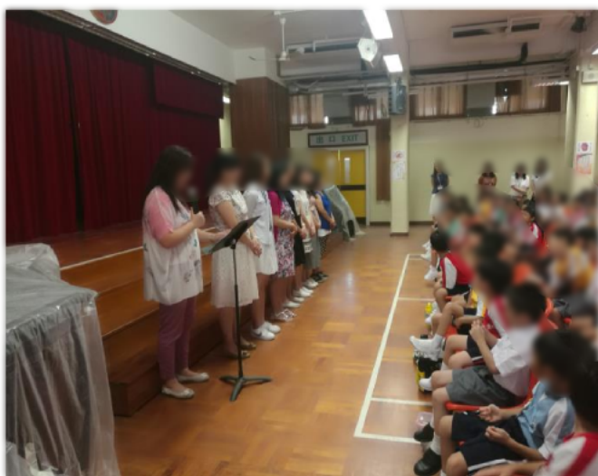
老師歡迎新生並且逐一作自我介紹。

學校明白小一新生的需要,每年8月會舉行小一適應活動,「呂小樂繽紛」,當中會向新生介紹班主任及任教老師,並會帶他們參觀校園,以了解及認識學校,加強他們的歸屬感。另外,老師會與他們上課,提早讓他們適應課堂規則。老師也會透過小遊戲讓學生互相認識,在班上結識朋友。同學表示適應活動可以幫助他們了解校園,並且認識新朋友,讓他們更快適應小學校園生活。