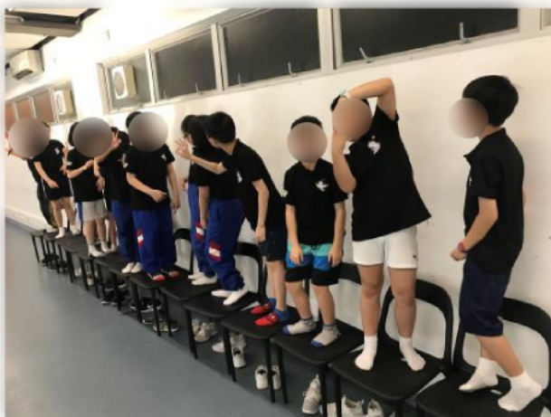
同學投入參與「溝通密碼」,建立正面溝通方法。

此外,學校參加了「成長的天空計劃」,對象是四至六年級的學生。這是一套全面的個人成長輔助計劃,目的是提升小學生的抗逆力,以面對成長的挑戰。學生參加這計劃後,在情緒控制、解決困難、訂定目標、建立關係等各方面都有進步。家長及教師均認為學生參與這計劃有助鞏固學生樂觀的態度、增強對家庭和學校的歸屬感,而學生在與人溝通和合作方面亦均有進步。